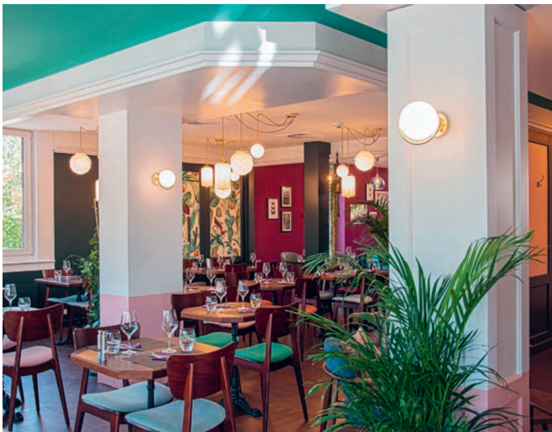
Diebold a décidé de rajeunir les boiseries dans le restaurant de l'Union en les peignant dans un mix de verts anglais, de rose tendre et de blanc.